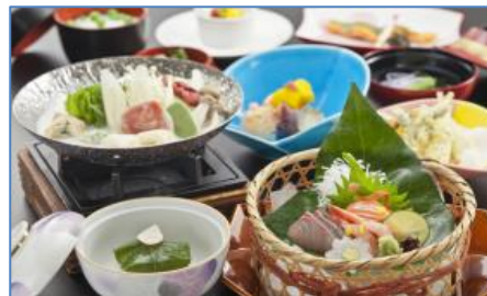
(写真は、イメージです)